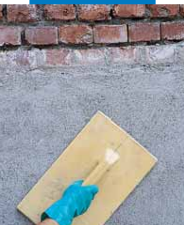
Zacieranie tynku z zaprawy Mape-Antique MC przy pomocy pacy