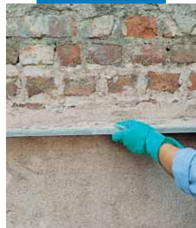
Wyrównywanie warstwy świeżego tynku wykonanego z Mape-Antique MC przy pomocy łaty