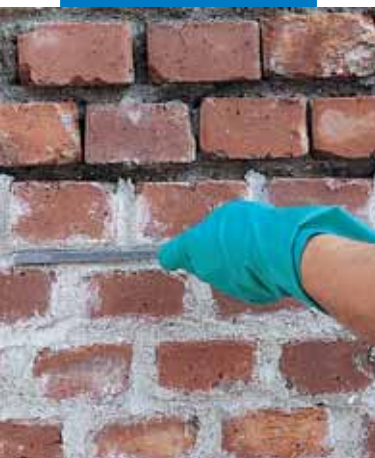
Wypełnianie szczelin pomiędzy cegłami

deszcz, kapilarne podciąganie wody, mikropęknięcia będące skutkiem skurczu plastycznego, reakcje alkalia-kruszywo, agresywne działanie siarczanów często występujących w murach.