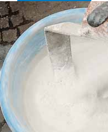
Przygotowywanie mieszanki Mape-Antique MC