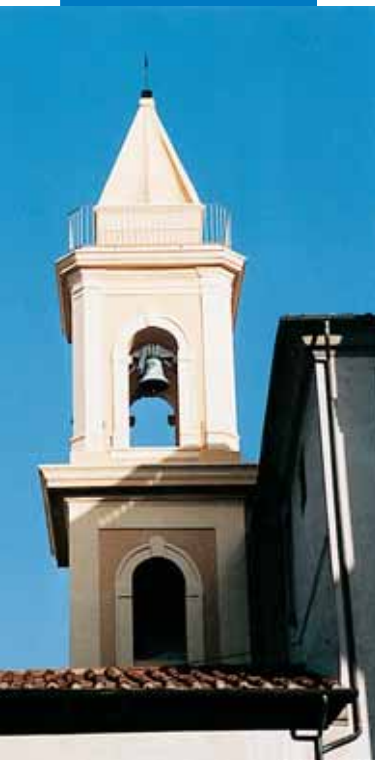
Wieża dzwonnicy odrestaurowana z zastosowaniem Mape-Antique MC

Referencje dotyczące produktu są dostępne na żądanie oraz na stronach: www.mapei.pl oraz www.mapei.com