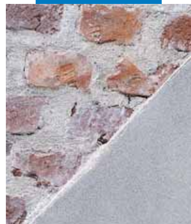
Zbliżenie: Mape-Antique MC zastosowana do spoinowania i tynkowania