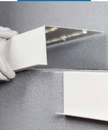
Elastyczne łączenie elementów