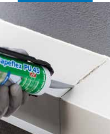
Elastyczne uszczelnianie złączy

bezozpuszczalnikowy i ma nieznaczny wpływ na środowisko. Mapeflex PU45 FT jest zgodny z normą EN 15651-1 („Kity do elementów fasad”) F-EXT-INT-CC oraz z normą EN 15651-4 („Kity stosowane do przejść dla pieszych”) PW-EXT-INT-CC. Mapeflex PU45 FT twardnieje pod wpływem reakcji z wilgocią obecną w atmosferze, a jego specjalne właściwości gwarantują długi okres użytkowania. Może być stosowany na pionowych i poziomych powierzchniach. Produkt jest gotowy do użycia i dostępny w aluminiowych, miękkich wkładach, które umożliwiają jego aplikację przy użyciu specjalnego pistoletu, co sprawia, że układanie produktu jest łatwe. Konsystencja produktu pozwala na szybką aplikację, a dzięki szybkiemu utwardzaniu powierzchni, na których go zastosowano mogą być w krótkim czasie oddane do użytku, co przekłada się na korzyści ekonomiczne. Mapeflex PU45 FT może być pokryty farbą dopiero po całkowitym utwardzeniu. Zaleca się stosować farby elastomerowe, takie jak Elastocolor Pittura po uprzednim pomalowaniu warstwą Colorite Performance . Zawsze należy przeprowadzić próbną aplikację, której celem będzie weryfikacja kompatybilności uszczelniacza i farby.