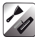
APLIKACJA SZPACHELKĄ / PACĄ