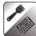
APLIKACJA PĘDZLEM / GĄBKA