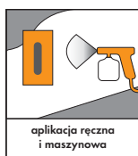
aplikacja ręczna i maszynowa