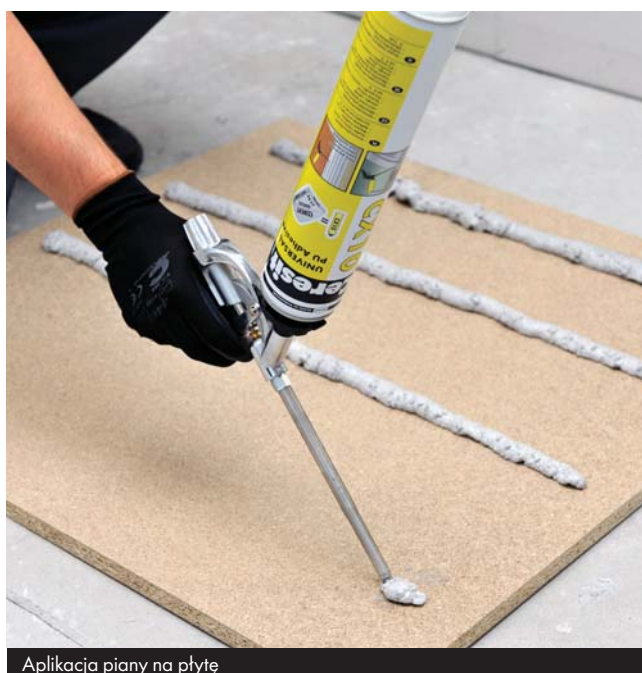
Aplikacja piany na płytę