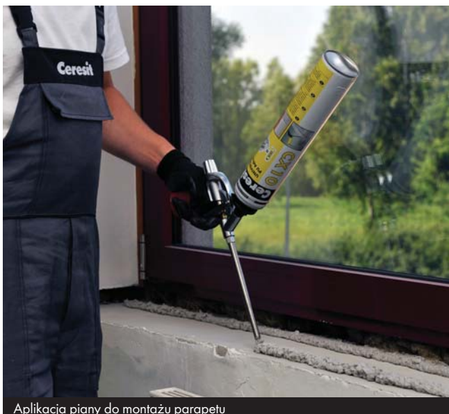
Aplikacja piany do montażu parapetu