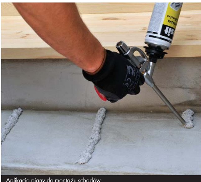
Aplikacja piany do montażu schodów