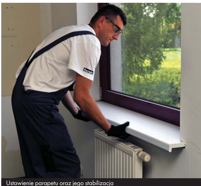
Ustawienie parapetu oraz jego stabilizacja