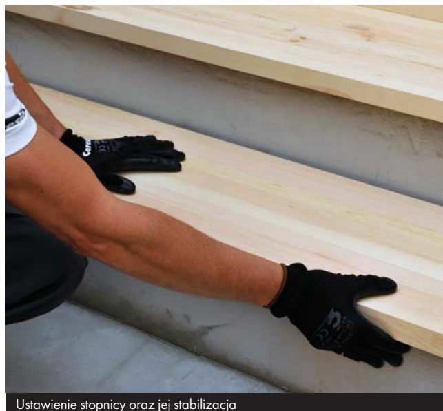
Ustawienie stopnicy oraz jej stabilizacja