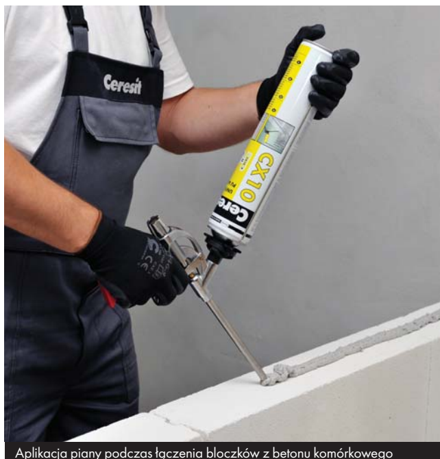
Aplikacja piany podczas łączenia bloczków z betonu komórkowego

UWAGA! Nie stosować do łączenia bloczków o tolerancji wymiarów wynoszącej > 1 mm i o nieregularnym kształcie. Nie stosować do wykonywania ścian nośnych, tylko do ścian działowych.